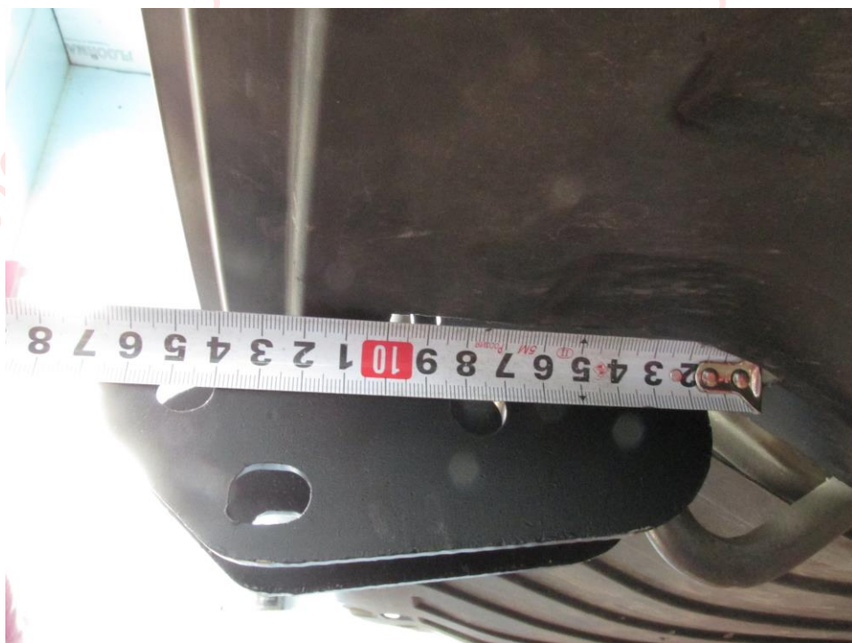
ТСУ 7611. Рис.2. Вырез в защите бампера.